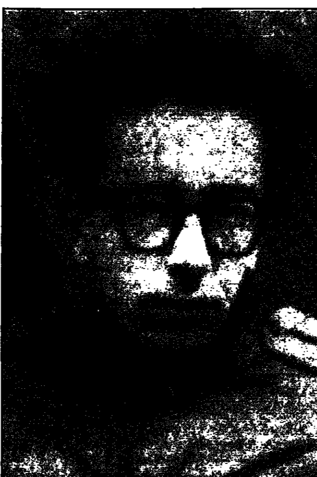
صورة لاسماعيل كاداريه في شبابه

هل يمكن أن نتحدث لنا عن تأثير اللغة العثمانية على اللبناني؟ لقد لثرت الامبراطورية العثمانية على اللبناني وشبه جزيرة البلقان تأثيراً كبيراً، وخصوصاً التأثيرات الالمانية العثمانية والكاتب هم كاتبه لا أكثر ولا أقل.